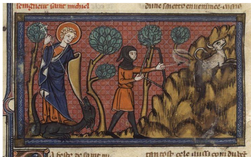
The Bull of Monte Gargano, The lives of the saints (BNF Fr. 185, fol. 259v), second quarter of the 14th Century

Pour vous rappeler notre prochain congrès... et ses bovins, ici au Monte Gargano: