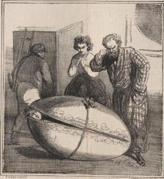
L'ŒUF DE PAQUES

- Animal de commissionnaire! je lui avais recommandé de ne pas donner l'œuf si le mari était revenu de la campagne!