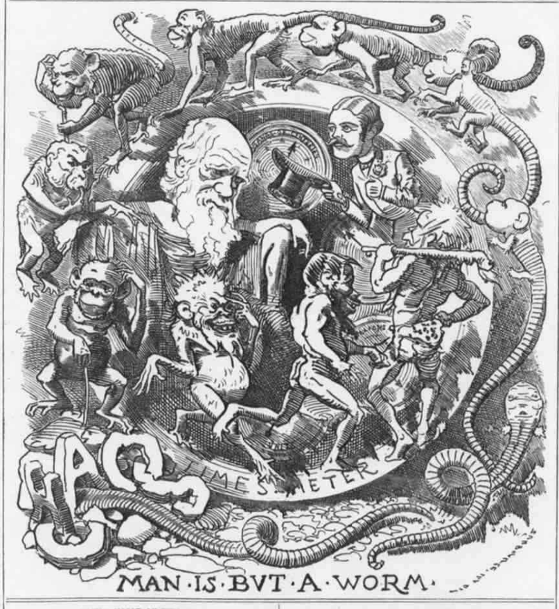
MAN IS BVT A WORM.